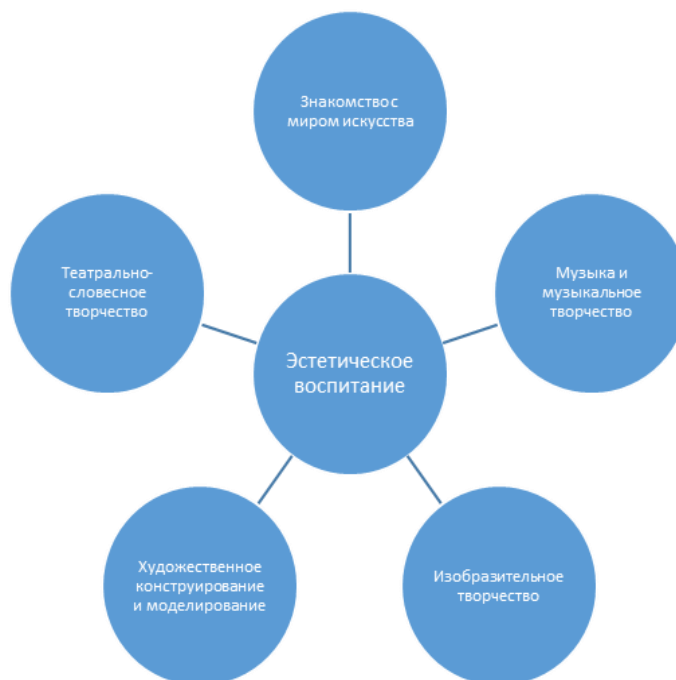
Схема «Эстетическое воспитание»